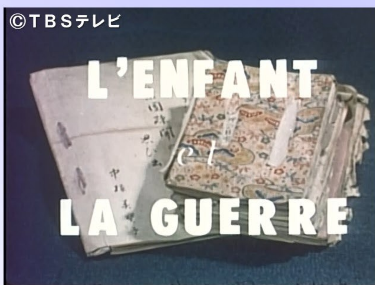
カメラルポルタージュ「疎開絵日記」

所在地:横浜市中区日本大通11 横浜情報文化センター8階 / 電話:045-222-2828 交通案内:みなとみらい線「日本大通り駅」3番情文センター口直結、JR・横浜市営地下鉄「関内駅」徒歩10分